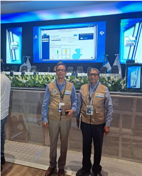
Foto: Los coordinadores de la MOE-FRENAEL desde el punto de proyección de datos oficiales del Centro de Información del Tribunal Supremo Electoral de Guatemala, cuando el recuento de votos era 99.5%.