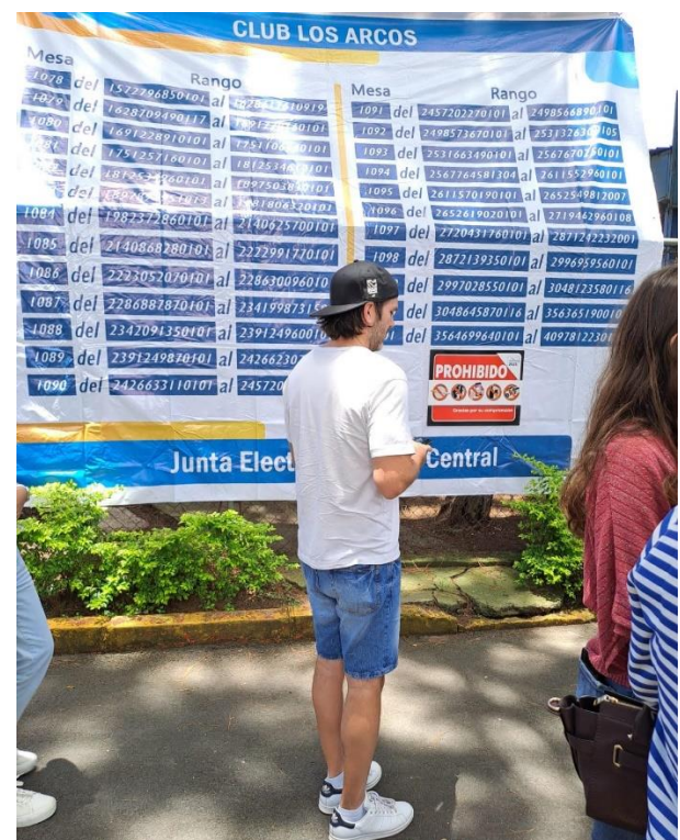
Foto: Votante buscando su JRV.

El centro de votación Los Arcos se encuentra ubicado en una zona de clase media alta de la ciudad de Guatemala. No se observó que algún partido político tuviera carpas alrededor del centro de votación con el fin de orientar a los votantes. En su lugar, en la entrada al centro había un banner con la información de las 24 JRV para que los electores revisaran en cuál junta les tocaba votar, de acuerdo con su documento personal de identificación.