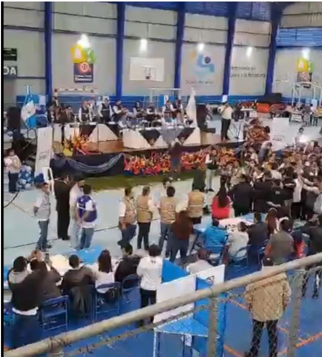
Foto: Inauguración del proceso electoral por el pleno de magistrados del TSEG.