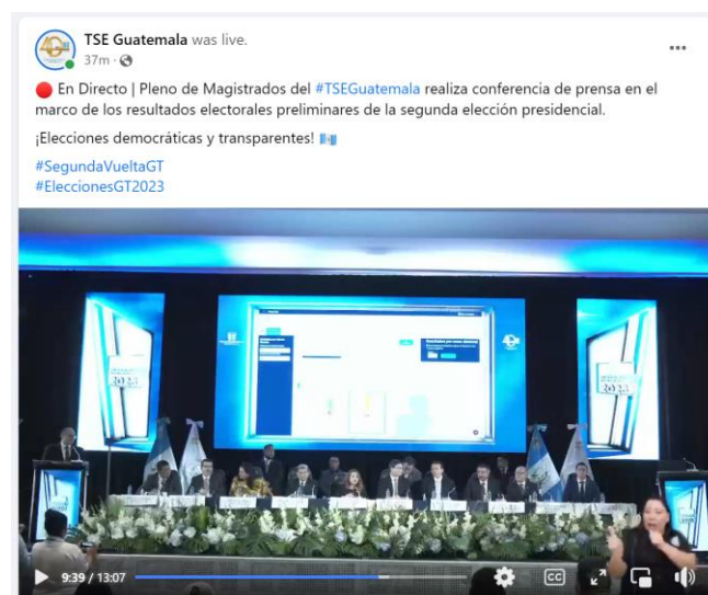
Foto: Transmisión del TSEG vía Facebook Live, brindando las estadísticas hasta las 8:00 p.m. Ver: https://fb.watch/myx075rkDv/