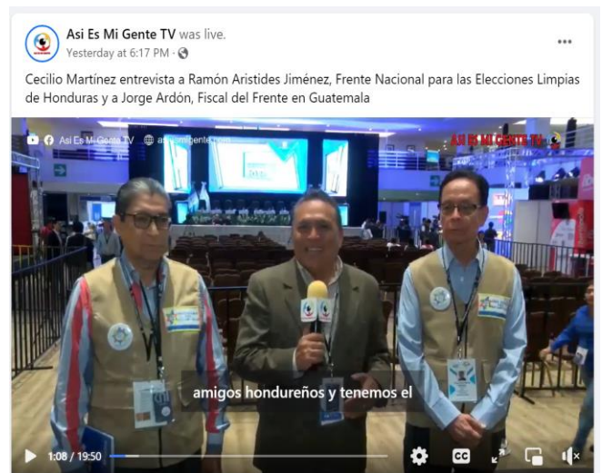
Foto: Entrevista al medio Así Es Mi Gente. Ver en: https://fb.watch/myyHsfJe1B/ .