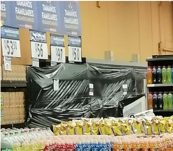
Foto: Uno de los negocios observados, cumpliendo la Ley Seca, cubriendo los freezers respectivos

Los negocios mostraban avisos de que no venderían bebidas alcohólicas, en cumplimiento a la Ley Seca mandatoria desde las 12 del mediodía del día anterior a las elecciones, hasta el lunes 21 de agosto a las 6:00 a.m. Los medios de comunicación tenían acceso a las áreas de votación y registraban la actividad con normalidad.