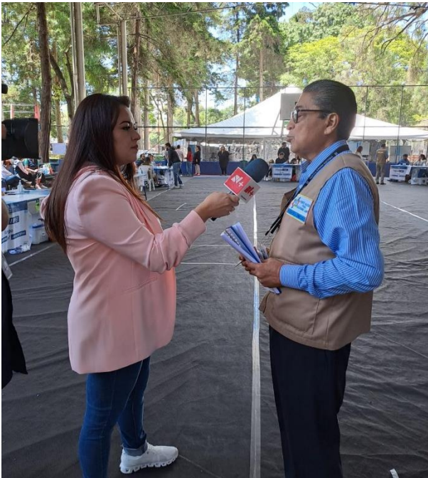
Foto: Periodista entrevista al Presidente del FRENAEL.

Los negocios mostraban avisos de que no venderían bebidas alcohólicas, en cumplimiento a la Ley Seca mandatoria desde las 12 del mediodía del día anterior a las elecciones, hasta el lunes 21 de agosto a las 6:00 a.m. Los medios de comunicación tenían acceso a las áreas de votación y registraban la actividad con normalidad.