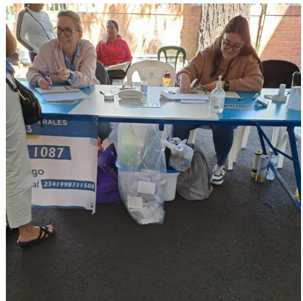
Foto: Bolsa colectora de votos.

Se pudo conversar con los integrantes de las JRV y se observó actitud positiva ante la observación y normalidad en la ejecución de los procesos de votación, así como un ambiente pacífico y ordenado. Los observadores de FRENTEL pudieron conocer detalles del sistema de la ciudadanía de las JRV.